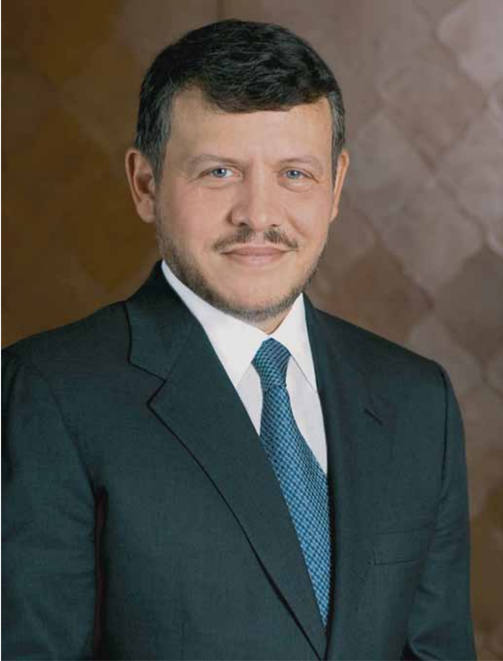
حضرة صاحب الجلالة الطاهمية الملك عبد الله الثاني ابن الحسين المعظم